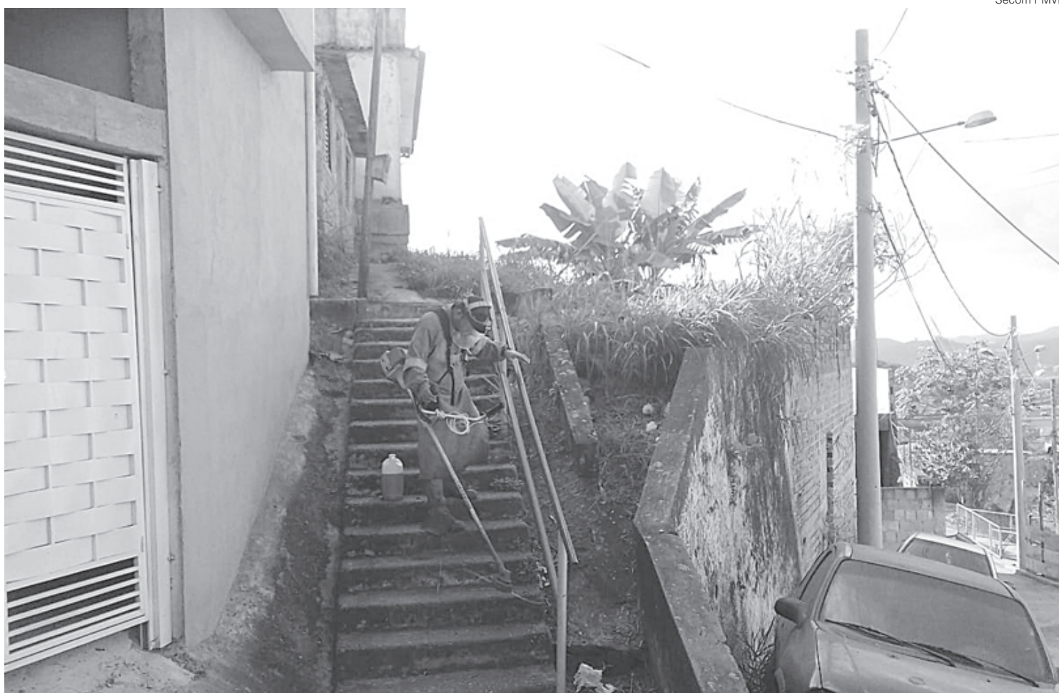
Trabalhadores da SMI visitaram vários bairros de Volta Redonda

Seguindo a programação da SMI, nesta terça-feira, 20, as equipes estiveram percorrendo os bairros Vila Rica, Casa de Pedra, Jardim Tiradentes, Morada da Colina, Jardim Normandia.