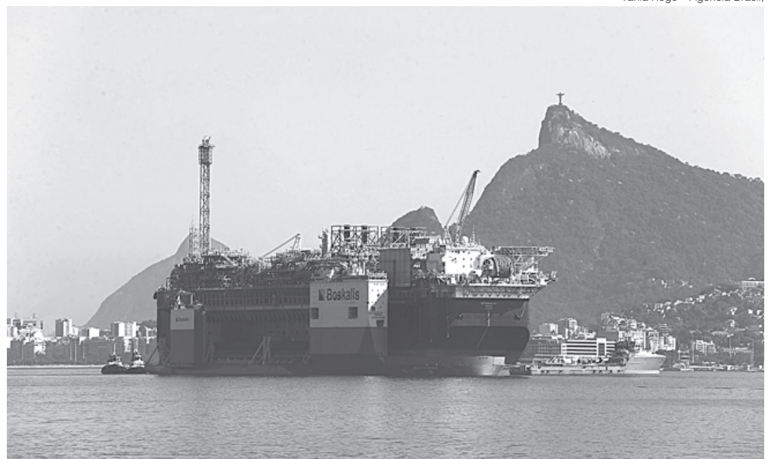
Bacia de Santos mantém recorde de produção de petróleo

Por Léo Rodrigues - Repórter da Agência Brasil