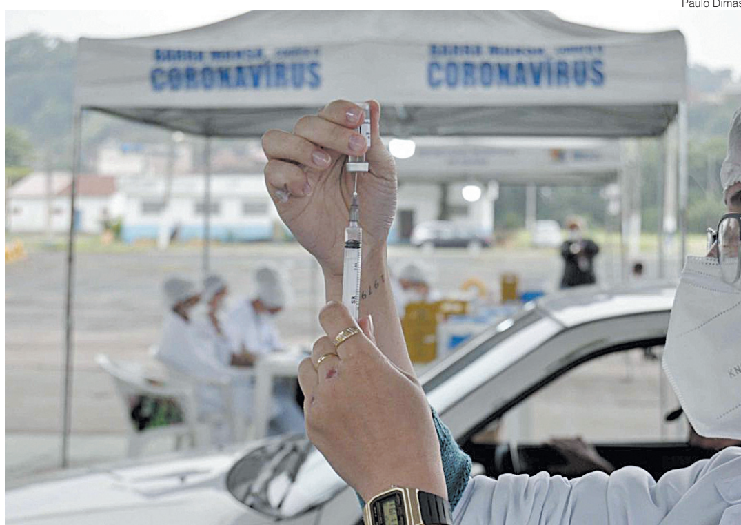
Vacinação em Barra Mansa acontece no Parque da Cidade