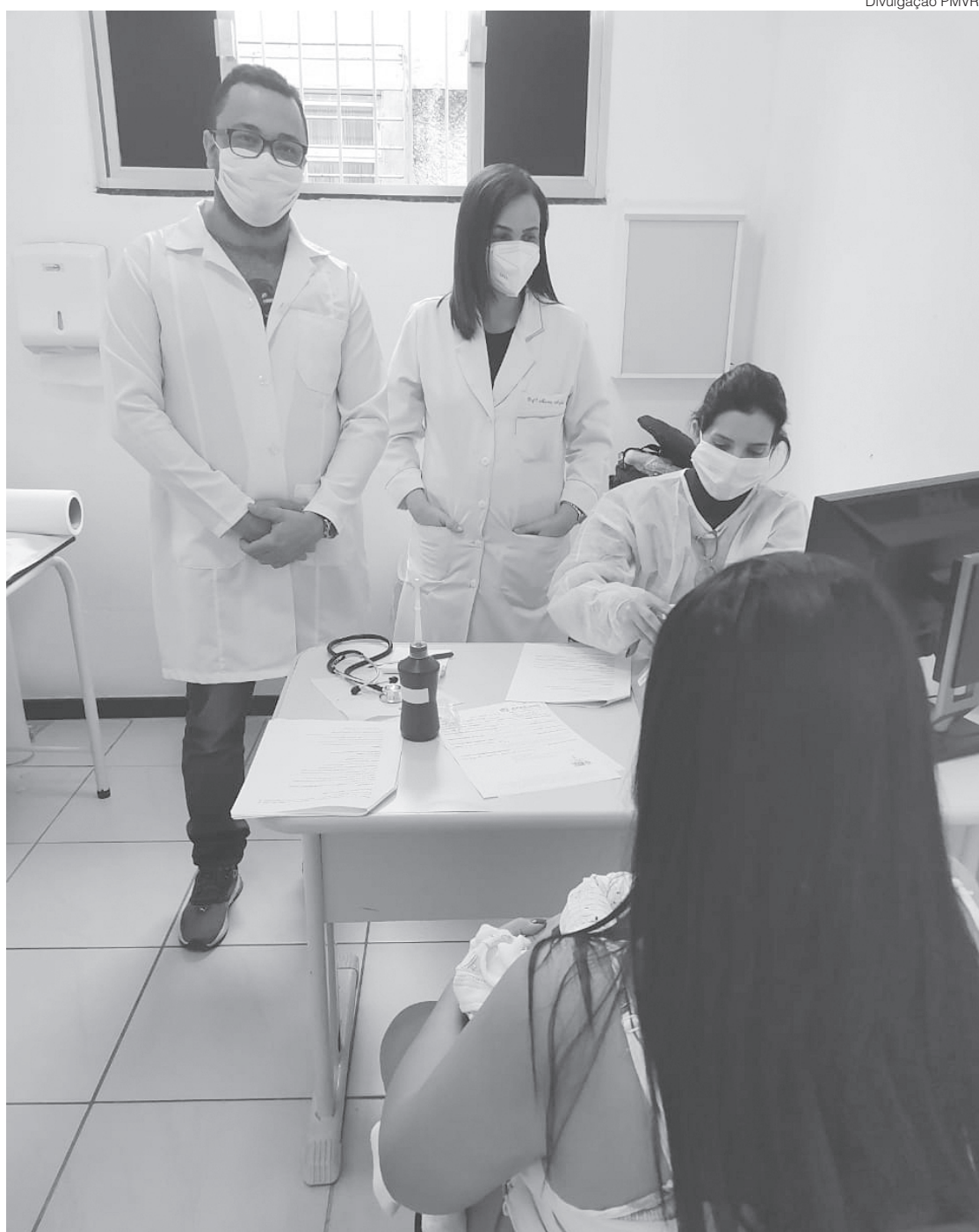
Atualização é realizada nas Unidades Básicas de Saúde da Família (UBSFs) do Conforto, Açude I e Santo Agostinho

Os profissionais da Atenção Básica devem estar capacitados para atender a gestante, a criança na primeira e na segunda infância, adolescentes, jovens, pessoas na fase adulta e idosos. E a puericultura, que está sendo tratada na atualização, consiste numa subespecialidade da pediatria, que se preocupa com o acompanhamento integral do processo de desenvolvimento infantil. Busca analisar o processo de crescimento, o desenvolvimento físico e motor; a linguagem, a afetividade e a aprendizagem cognitiva da criança.