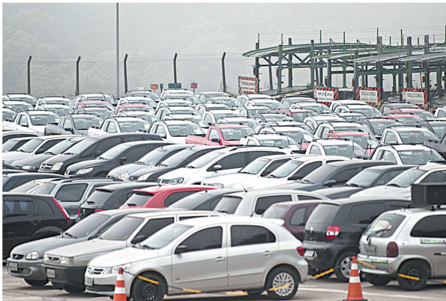
Vendas de carros usados e novos começam a melhorar em Volta Redonda

Mercado de veículos novos e usados reage no primeiro trimestre se comparado com o mesmo período do ano passado em Volta Redonda