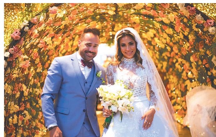
Os noivos atravessando um túnel de flores e luzes