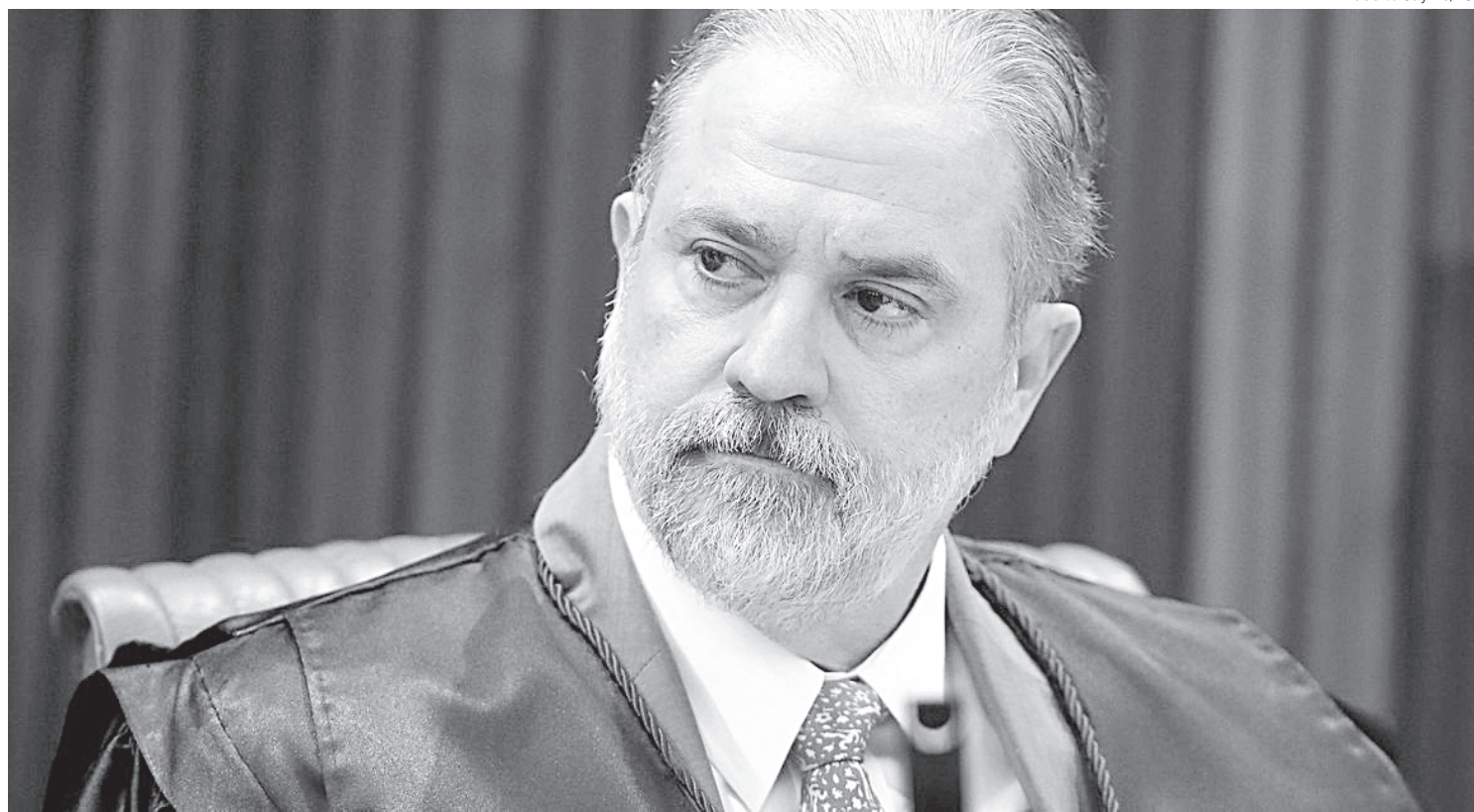
Com a decisão, Bolsonaro rejeita novamente a lista tríplice proposta pelo Ministério Público