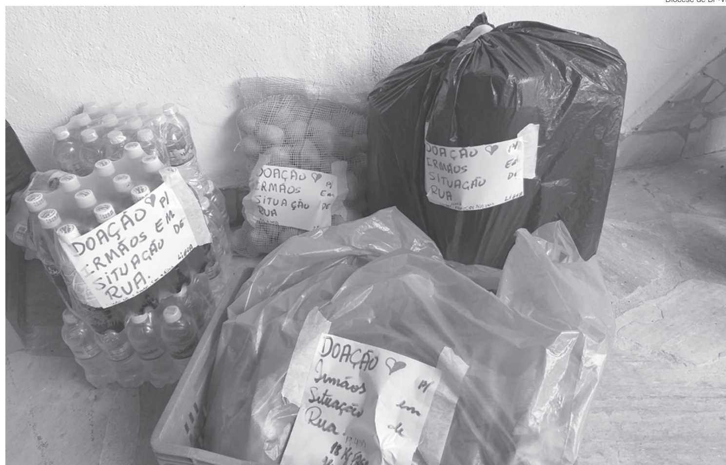
Diocese de BP-VR

Para quem deseja fazer doações, pode entregar nas secretarias das paróquias e pode doar materiais para fazer as fitas, flanelas e cobertores. Eles transformam as flanelas em cobertores e também preparam fraldas de pano.