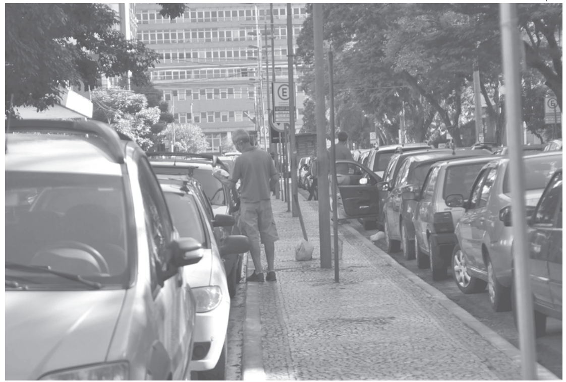
Mercado de veículos cresce no primeiro semestre de 2021 em comparação com 2020

Abril de 2020 foi o primeiro mês em que as restrições duraram o mês inteiro; o resultado foram