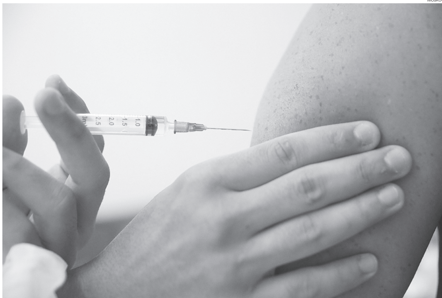
Mais de 15% da população fluminense já recebeu a imunização com as duas doses ou dose única