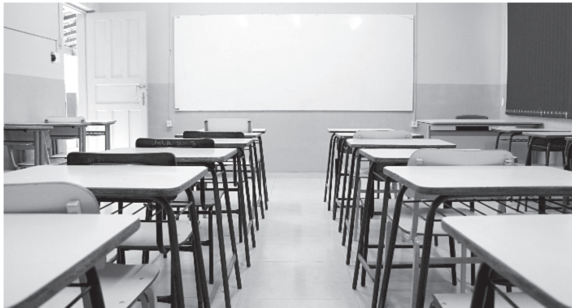
Aulas presenciais serão iniciadas no dia 02 de agosto