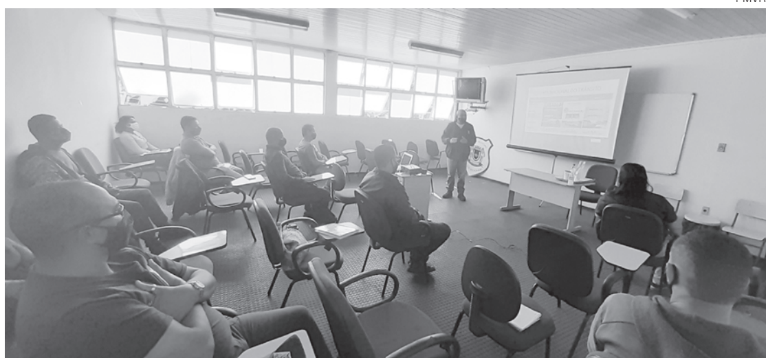
Corporação em Volta Redonda vem apoiando a formação de agentes em toda a região

O curso, que vai até o dia 22, é uma exigência do Denatran (Departamento Nacional de Trânsito), que através da Portaria nº 94/2017, prevê a necessidade de capacitação em curso especializado para os profissionais que executam as atividades de fiscalização nos órgãos integrantes do Sistema Nacional de Trânsito. Durante a atualização, os guardas municipais recebem instruções práticas e teóricas sobre como atuar em situações de trânsito, técnicas de abordagens e operações.