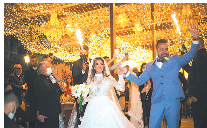
Chegada irradiante dos noivos no elegante espaço de festas Villa Paolucci