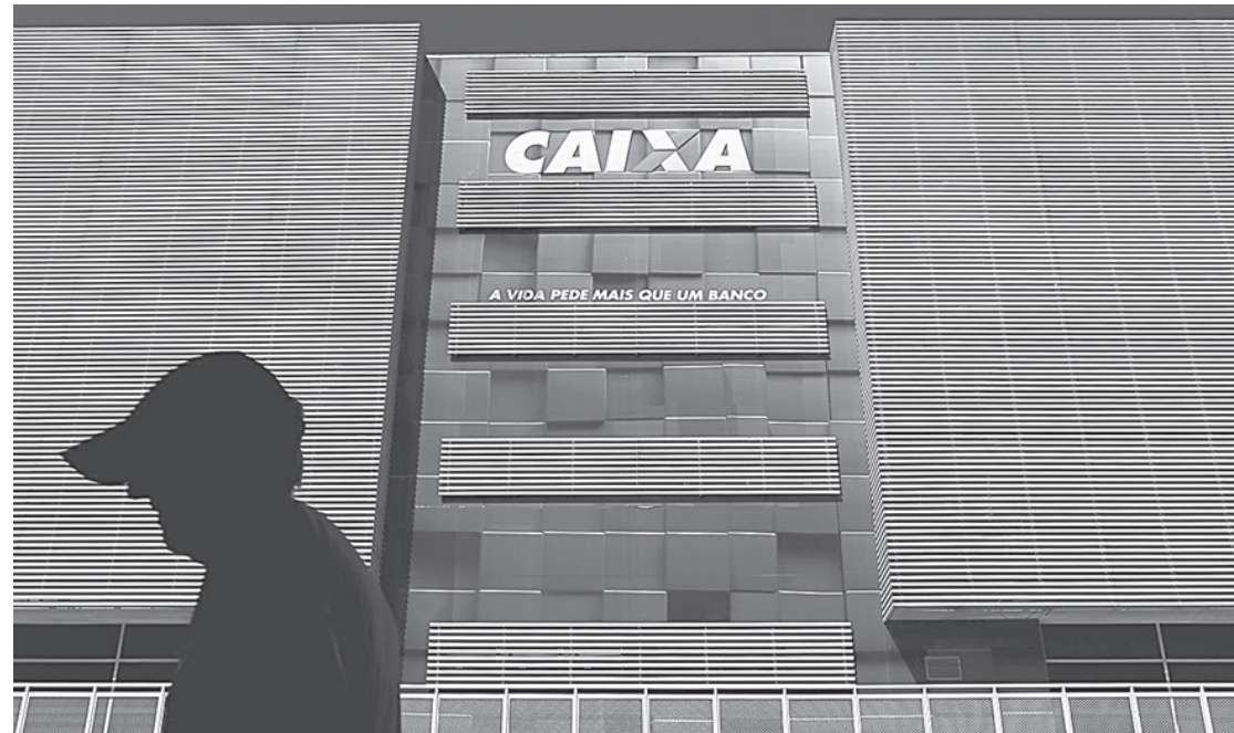
Novas agências da Caixa vão começar a funcionar este ano

No Sudeste, serão inauguradas 30 unidades: 13 em São Paulo, 7 em Minas Gerais, 7 no Rio de Janeiro e 3 no Espírito Santo. No Centro-Oeste, a Caixa abrirá 14 unidades: 7 no Mato Grosso, 5 no Mato Grosso do Sul e 1 em Goiás. O Sul receberá quatro unidades de varejo: 2 em Santa Cata-