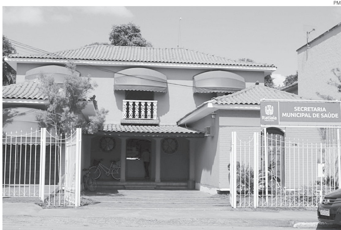
Ao todo serão atendidas 250 pessoas que estão aguardando na lista de espera pelos procedimentos